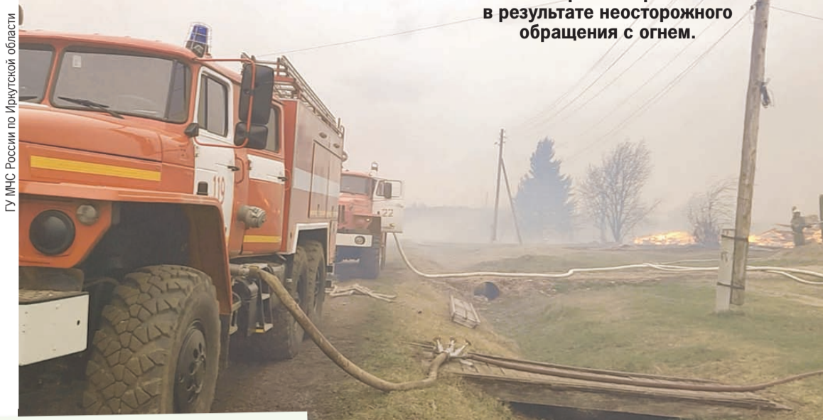
Причина пожара - загорелась трава в результате неосторожного обращения с огнем.

В Половино-Черемхово беда пришла около трех часов дня. Сообщение в МЧС о пожаре поступило в 15.14. Когда приехали первые подразделения уже горело четыре дома. Стихия бушевала на общей площади 4 гектара. Чтобы остановить ее спасатели использовали тяжелую технику. Тракторы и бульдозеры. С их помощью делают противопожарные разрывы, чтоб огонь не смог пройти дальше. На месте работали 69 человек, привлекли