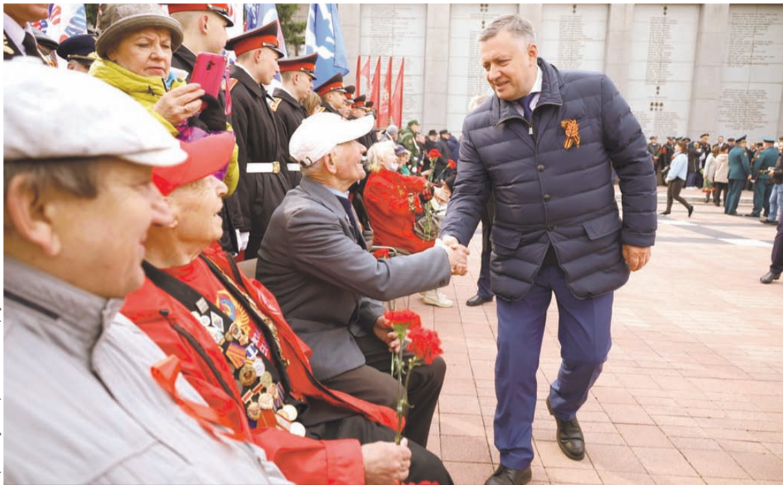
Губернатор региона лично поздравил ветеранов Великой Отечественной войны.

Губернатор подчеркнул, что сейчас страна переживает непростое время. Продолжается особая военная операция по освобождению республик Донбасса.