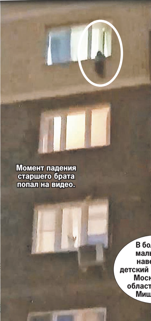
Момент падения старшего брата попал на видео.