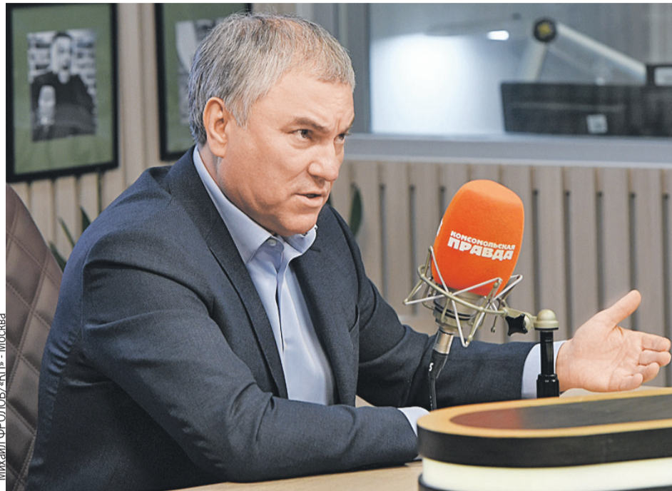
Вячеслав Володин в студии Радио «Комсомольская правда»: «Дальнейшая судьба освобожденных территорий Украины должна зависеть только от их населения».

А что касается «не договорившихся политиков», то они всем известны. Зеленский, Байден, главы стран НАТО. К ним вопросы. К нам какие вопросы? Мы предлагали диалог. Мы его вели. Но когда возможности дипломатии были исчерпаны и угроза пришла в наш дом, началась операция. И надо исходить из того, что граждане нашей страны