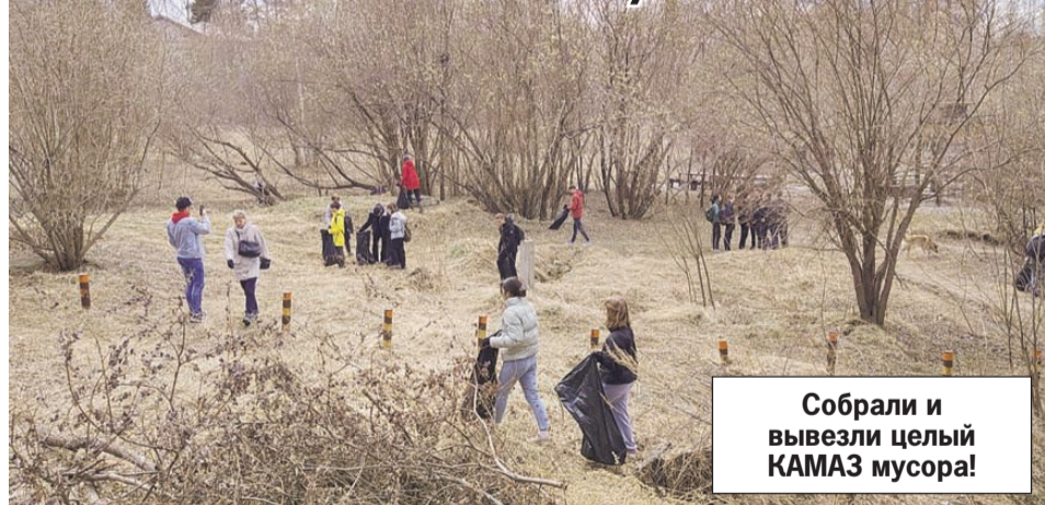
Собрали и вывезли целый КАМАЗ мусора!