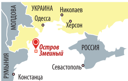
Украинский остров в Черном море. Входит в состав Измаильского района Одесской области. Площадь - 0,17 км 2 .