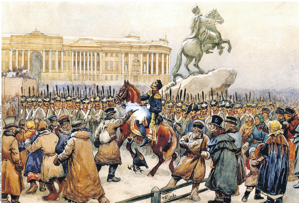
Акварель Василия Перова «Восстание декабристов». Петербургский генерал-губернатор Михаил Милорадович (в центре) убеждает солдат вернуться в казармы. И в этот момент в него стреляет отставной поручик Петр Каховский. Ранение оказалось смертельным...

- Можно учиться на их ошибках, можно ими восхищаться как людьми мужественными, пожертвовавшими многим ради своих идей. Но идеальными людьми они не были точно. К тому времени