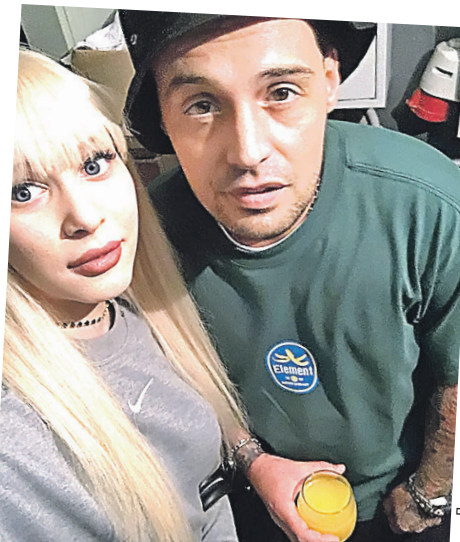
Яна (тогда она еще была блондинкой) сделала все, чтобы ее отношения с Гуфом перестали быть тайной.